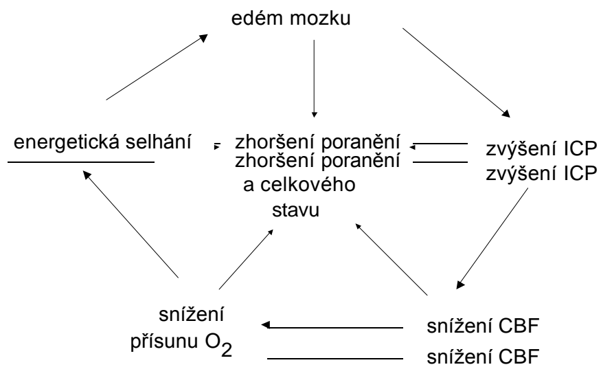
Obrázek 1. Eskalační cyklus otékání mozku zhoršující poranění mozku a celkový stav